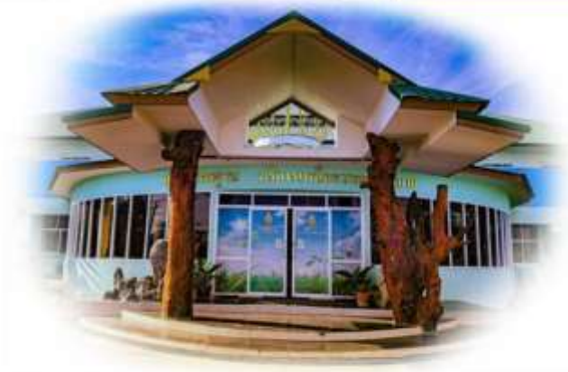
Education Area Management Support System ระบบสนับสนุนการบริหารจัดการสำนักงานเขตพื้นที่การศึกษา