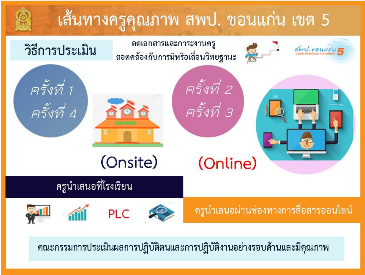
แผนภาพที่ ๑ แสดงกระบวนการการประเมินการเตรียมความพร้อมและพัฒนาอย่างเข้มของข้าราชการครูและบุคลากรทางการศึกษาตำแหน่งครูผู้ช่วย “เส้นทางครูคุณภาพ” ของสำนักงานเขตพื้นที่การศึกษาประถมศึกษาขอนแก่น เขต ๕

สำนักงานเขตพื้นที่การศึกษาประถมศึกษาขอนแก่น เขต ๕ กำหนดวิธีการประเมินการเตรียมความพร้อมและพัฒนาอย่างเข้มของข้าราชการครูและบุคลากรทางการศึกษาตำแหน่งครูผู้ช่วย “เส้นทางครูคุณภาพ” เพื่อลดภาระงานครูและบูรณาการกับการมีและเลื่อนวิทยฐานะโดยใช้กระบวนการประเมินแบบผสมผสานการนำเทคโนโลยีมาใช้ในการประเมินให้สอดคล้องกับการเปลี่ยนแปลงในศตวรรษที่ ๒๑ ซึ่งมีรายละเอียด ตามแผนภาพด้านล่าง นี้